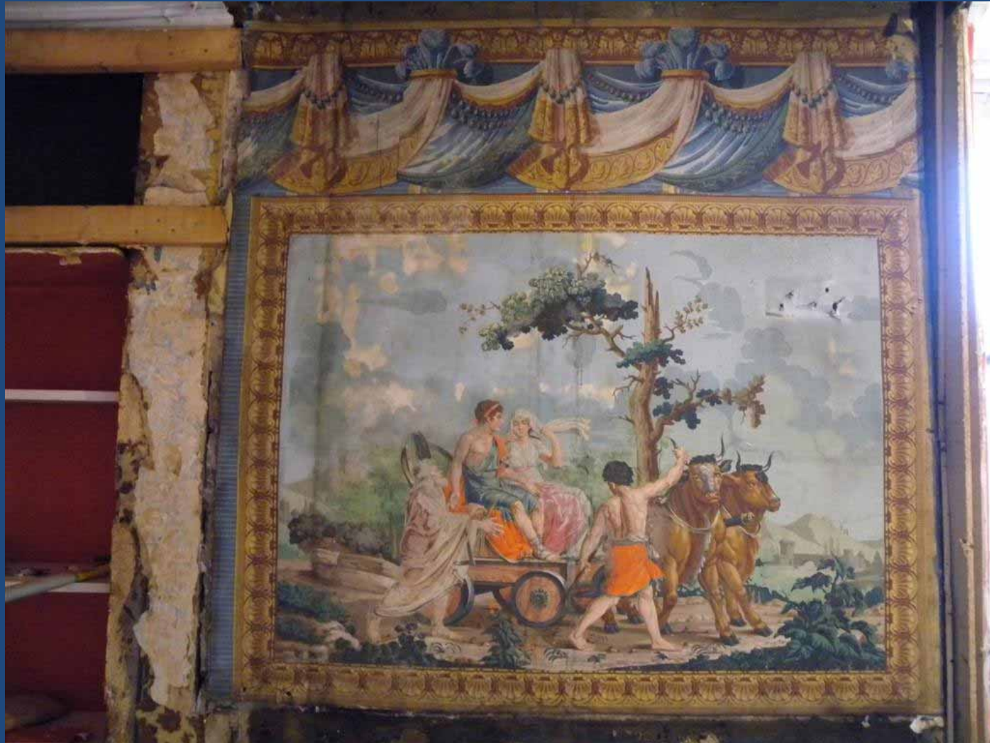
Blokdruk behang gevonden op schoorsteen